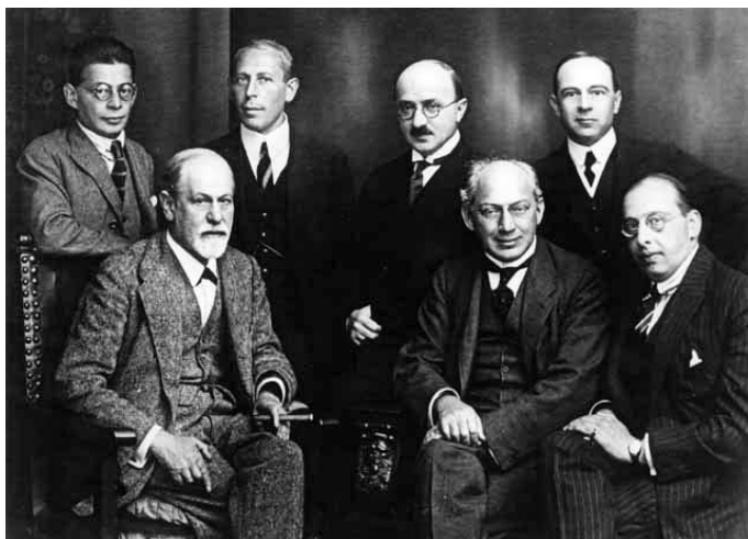
Iš kairės į dešinę sėdi: Sigmundas Freudas, Sándoras Ferenczi ir Hannsas Sachsas. Stovi: Otto Rankas, Karlas Abrahamas, Maxas Eitingonas ir Ernestas Jonesas, 1922

Psichoanalizės terminą mokslininkas pirmą kartą pavartojo 1896 m. po išsiskyrimo su bendražygiu Josefu Breueriu, taip siekdamas pabrėžti savo mokslinio požiūrio ir pasirinkto kelio originalumą. Tačiau psichoanalitinės teorijos formavimasis buvo ilgas ir sudėtingas; pagrindiniai jos sudėtiniai elementai buvo toliau konceptualiai grindžiami programiniuose 1905, 1914,