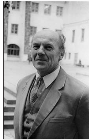
Romanas Plečkaitis, Lietuvos filosofijos istorijos tyrinėjimų patriarchas